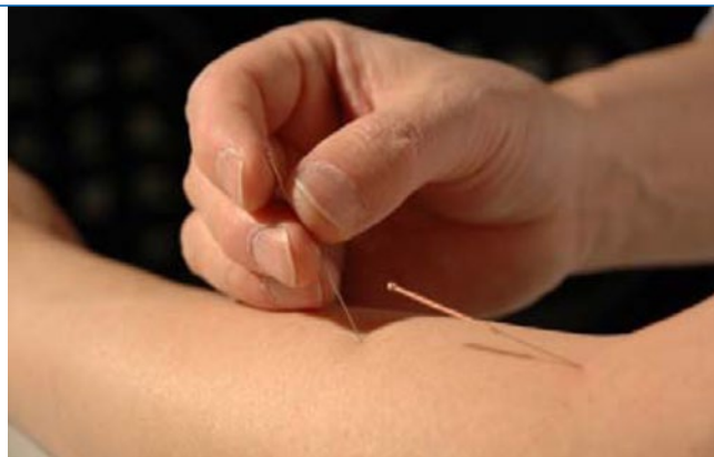
Abb. 2 ▶ Akupunktur an Di 11 und Di 10.

Mit dem Winter wird in der TCM das Alter charakterisiert. In dieser Zeit ist das Yang qi am schwächsten, das Yin qi am stärksten. Nach den 5 Elementen sind dem Winter Kälte, Wasser, das Speichern, Sammeln, Schlummern und die Ruhe zugeordnet. Man neigt dazu, sich in zu warmer Umgebung aufzuhalten und zu vielwarmer und trockener Nahrung zu essen. Personen